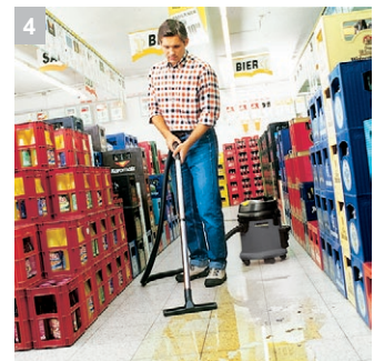
4 Прочный бампер