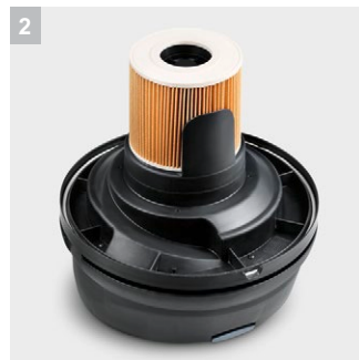
2 Фильтр со сменным фильтрующим элементом, с поплавковым регулятором